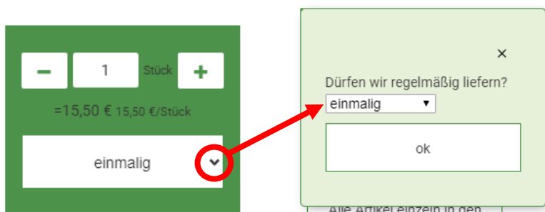
Abbildung 1: Abo hinterlegen

Du kannst bei jedem Artikel oder jeder Ökokiste individuell wählen, ob Du diese einmalig (für den ausgewählten Liefertag) oder dauerhaft für den von Dir gewählten Lieferrhythmus erhalten möchtest. Hast Du die Bestellung abgeschickt, siehst Du deine hinterlegten Abos im Profilbereich unter „ Mein Abo “.